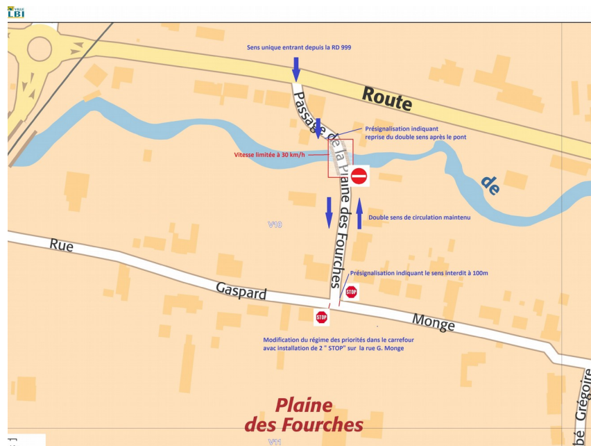
Proposition de modification du schéma de circulation

Ils proposent de mettre une autre chicane pour obliger les conducteurs à ralentir en faisant un « S » et souhaitent pouvoir rencontrer sur site l'élu et le technicien de l'agglomération en charge des questions de circulation.