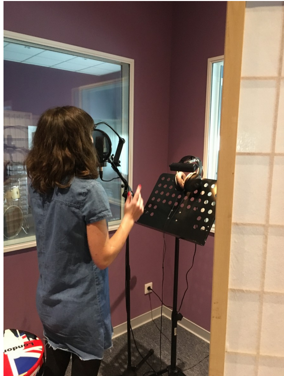
Répétitions des jeunes talents de quartier pour leur premier CD

jeunes désœuvrés et des acteurs économiques du territoire et proposer des parcours personnalisés d'insertion sociale et professionnelle.