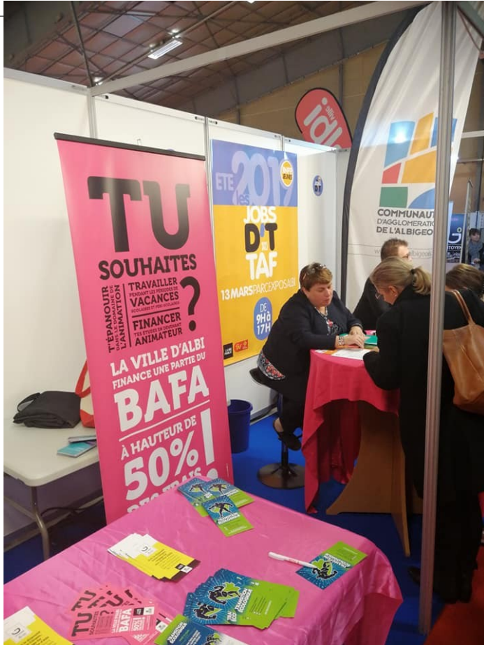
Le TAF , salon des jobs.

entre 16 et 25 ans afin de bénéficier d'une expérience complémentaire pour densifier leurs parcours vers l'emploi et valoriser leur engagement citoyen.