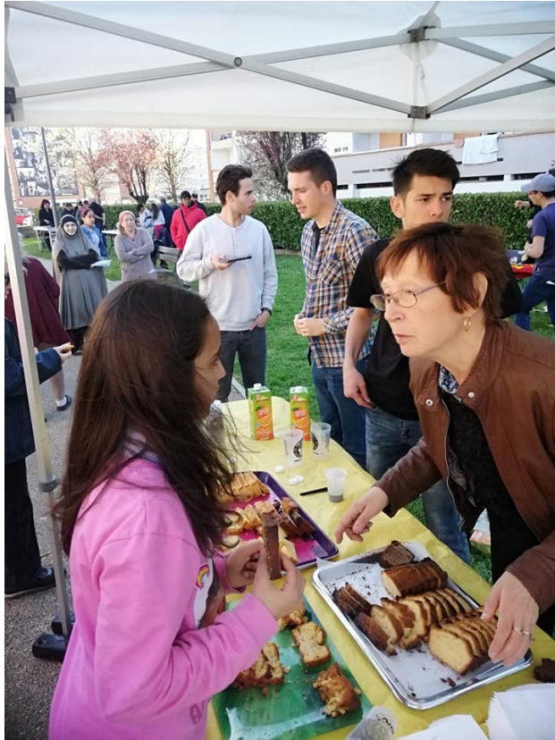
Les jeunes contribuent à l'organisation des manifestations de quartier

d'accueil de loisirs sans hébergement (en centres de loisirs).