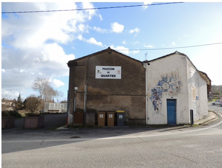
L'actuelle maison de quartier

Sa réhabilitation est inscrite au programme de l'équipe municipale actuelle pour ce mandat.