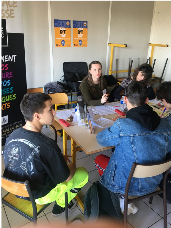
Dispositif Jeunes Citoyens

propose également trois dispositifs et a ouvert un Carré Jeunes situé à Veyrières , place du 19 mars 1962. Il s'agit d'un espace municipal pour aider les jeunes dans leur recherche d'emploi, leur formation et leur projet de vie au sens large (logement, santé, vacances...)