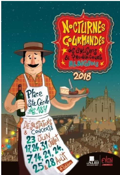
Les Nocturnes gourmandes reviennent en 2019

Le Directeur de la Communication Numérique de la ville d'Albi présente les animations prévues pour l'été 2019 en revenant sur celles qui ont marqué l'été 2018 et qui seront maintenues comme les Nocturnes Gourmandes .