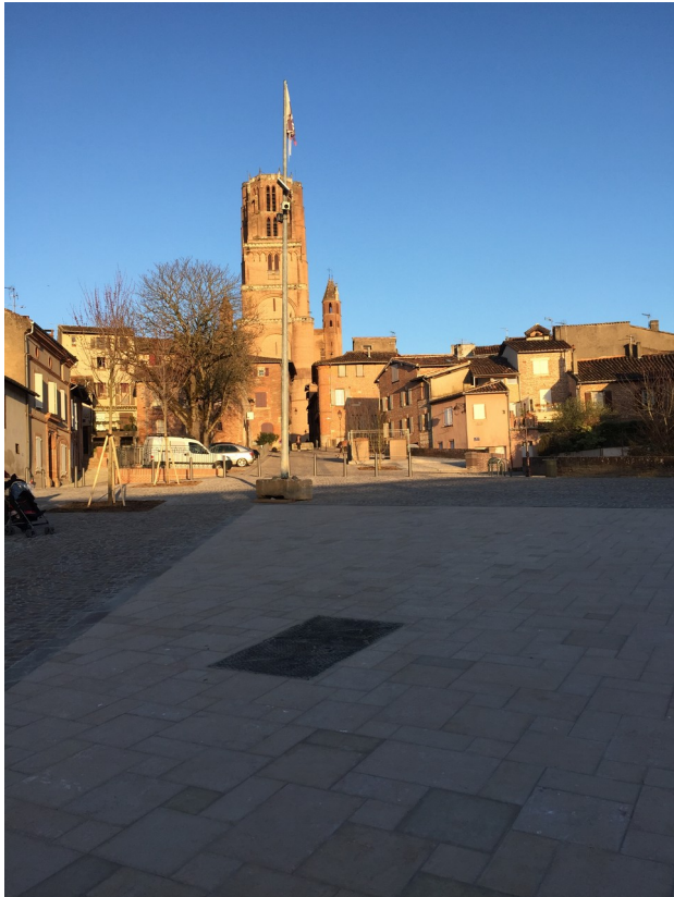
La place du château requalifiée

Enfin, les berges du Tarn feront l'objet d'une re-végétalisation au niveau de la zone des travaux.