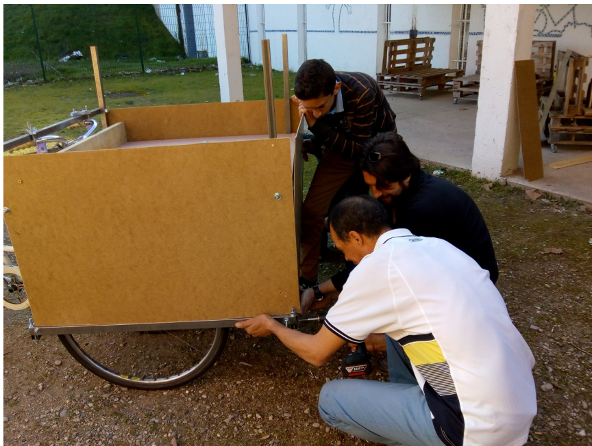
Construction d'un tri-porteur à l'atelier vélo

Requalification du patio de la maison de quartier avec un groupe de jeunes accompagnés par un artisan bénévole.