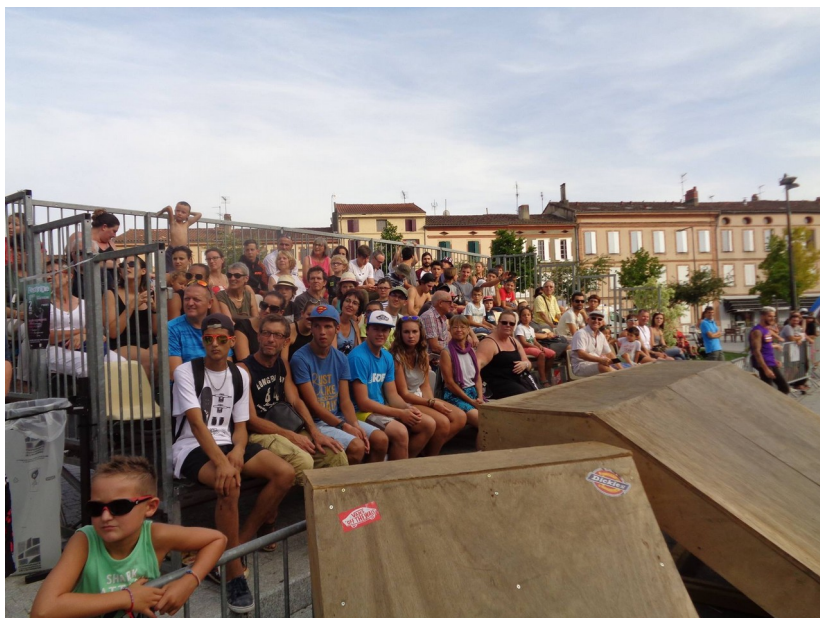
Des animations en coeur de ville permettent de réunir les jeunes de tous les quartiers