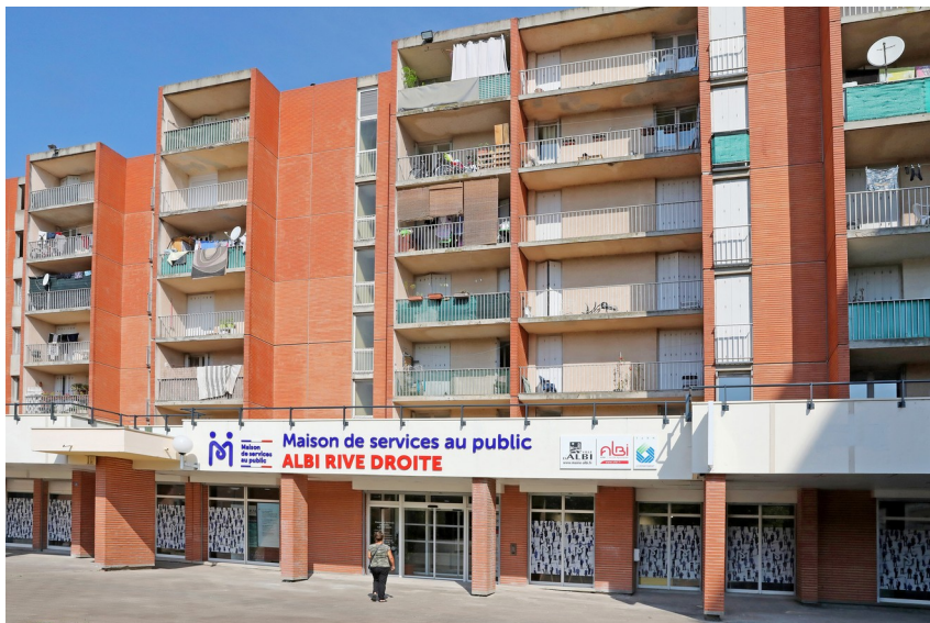
La MSAP ouverte fin juin 2018

La chargée de projet rénovation urbaine de l'agglomération et le directeur adjoint de Tarn Habitat font un point d'étape sur le calendrier et l'avancée de l'opération de renouvellement urbain.