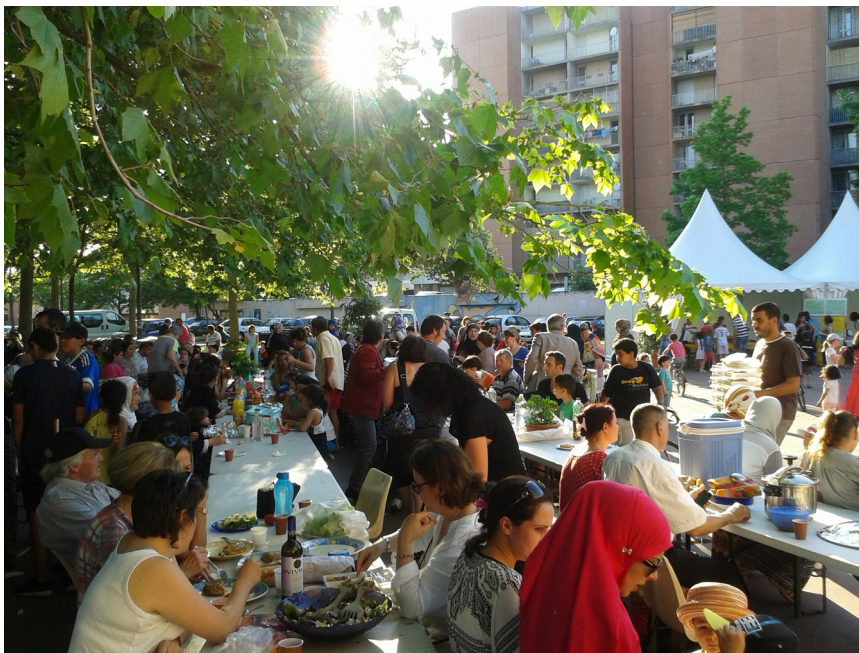
Le Printemps des cultures 2018