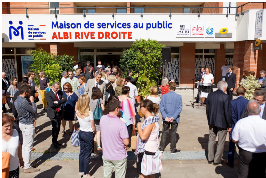
Inauguration de la MSAP -septembre 2018

Il est également rappelé que la Caisse Primaire d'Assurance Maladie maintient et développe son activité sur le site avec la venue d'une vingtaine d'agents. Dans cette optique, des travaux sont programmés sur le bâtiment.