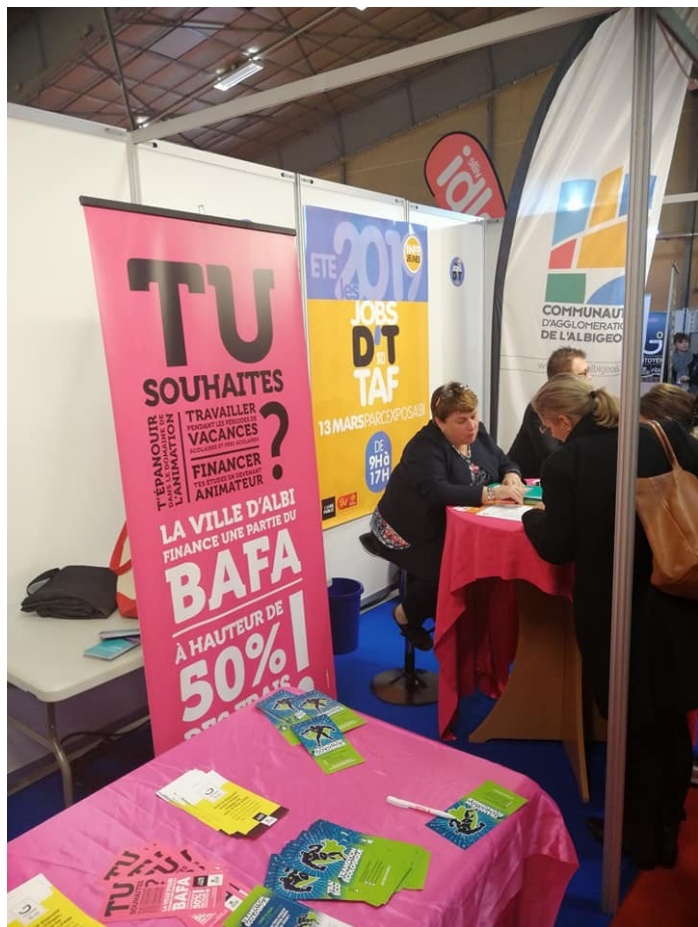
Stand du service jeunesse-insertion de la ville d'Albi au Salon régional du TAF

Enfin, les conseillers prennent connaissance des dispositifs mis en place par la Ville en direction des jeunes.