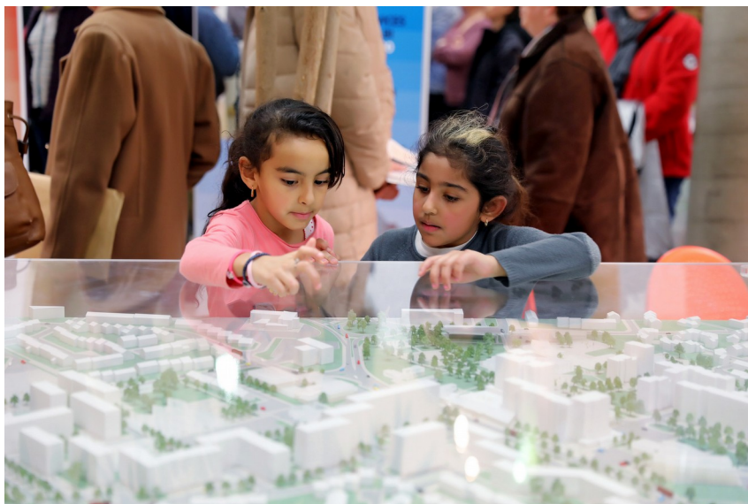
La maquette du quartier aujourd'hui

La chargée de projet rénovation urbaine de l'agglomération présente ensuite aux conseillers le programme des interventions de l'opération de renouvellement urbain étalées jusqu'en 2025. C'est sur la base de cette programmation que l'ensemble des partenaires et l'ANRU signeront la convention d'engagement en juillet 2019.